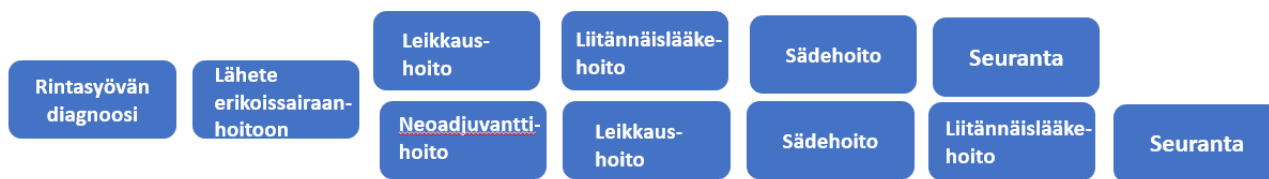
Kuva 1. Varhaisvaiheen rintasyöpäpotilaan hoitopolku yhä useammin alkaa neoadjuvanttihoidolla ja vasta sitten edetään leikkaukseen. Neoadjuvanttihoitoarvio edellyttää erikoissairaanhoidossa paksuneulabiopsioista hormonireseptori-, Ki67- ja HER2-värjäyksen määrittämistä hoitopolun valinnan mahdollistamiseksi.